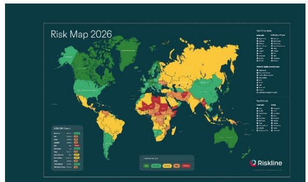
Empleabilidad y formación en un mundo en cambio: Claves del Global Risks Report 2026