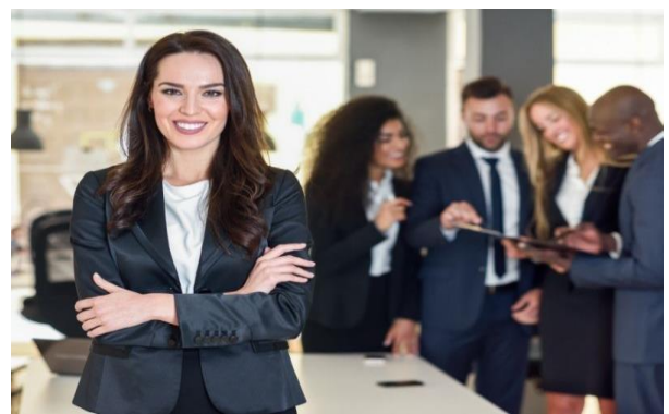
Liderazgo Femenino como motor de innovación, crecimiento y excelencia empresarial