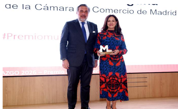
XIX Foro de Mujer y Liderazgo y Entrega del Premio Mujer Líder 2025