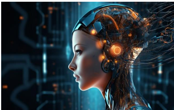
Enfoques globales de la IA generativa: Iniciativas estratégicas e impactos